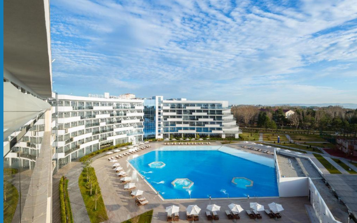
Мovenpick Resort & SPA Анапа Miracleon Адрес: г. Анапа, Пионерский проспект, д. 253-1