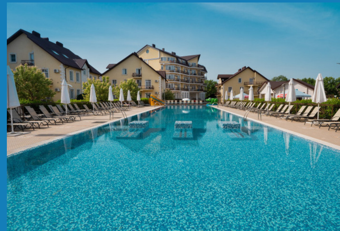
Дивный Мир Усадьба Шато Адрес: г. Анапа, п. Джемете, Пионерский проспект, 81Б