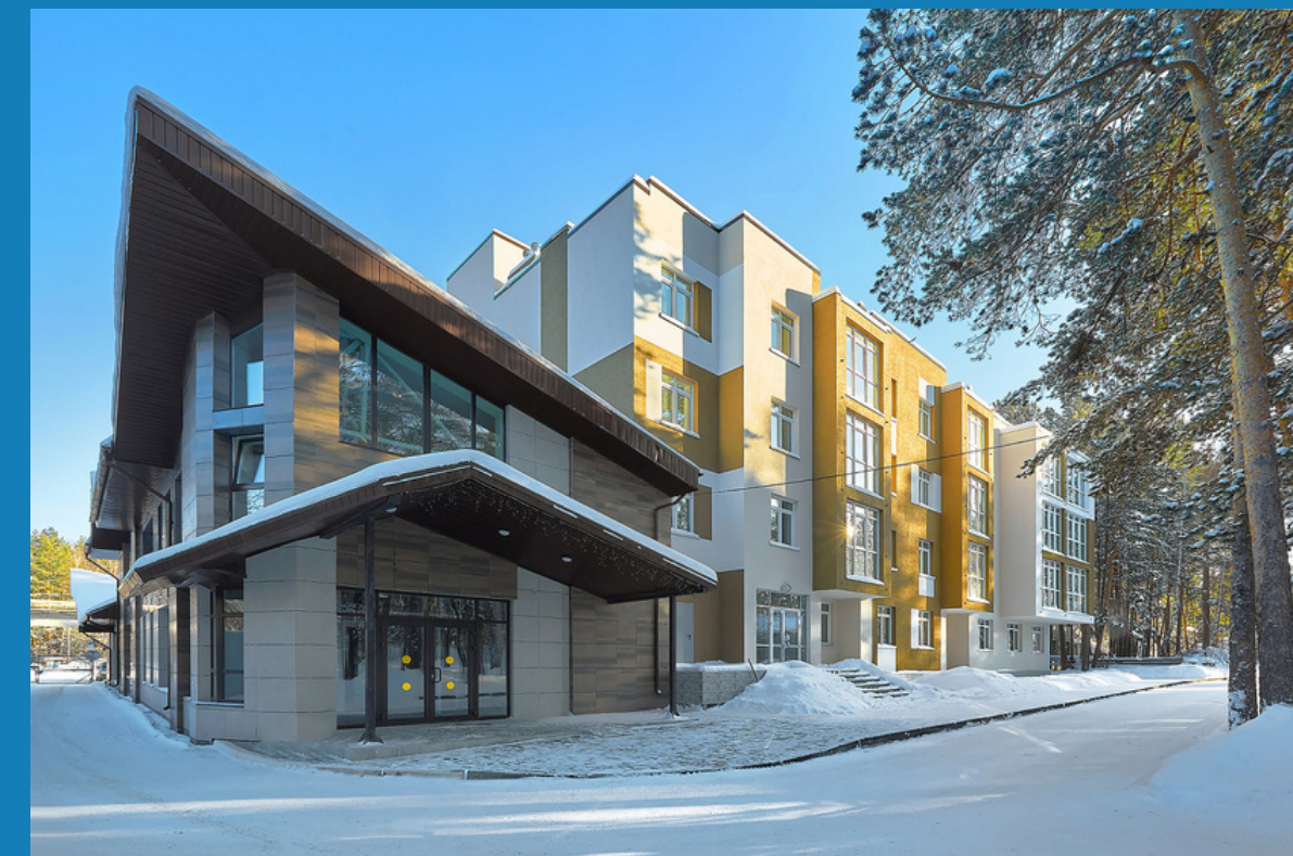
Семейный курорт «Утес» Адрес: Челябинская область, Чебаркуль оз. Б. Кисегач и оз. М. Теренкуль