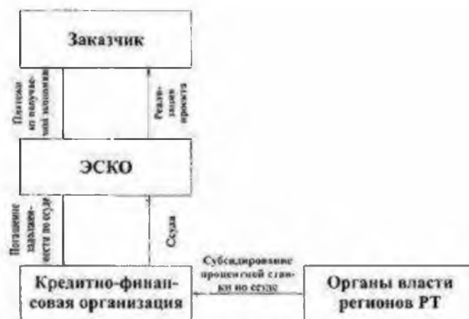
Рис. 3.4. Схема субсидирования процентной ставки по банковским ссудам, выдаваемым на реализацию энергосберегающих проектов