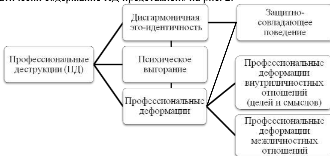
Рис. 2. Схематическое содержание ПД

вследствие недостаточной рефлексии. Защитно-совладающие механизмы замещают рефлексивность и препятствуют ей. Формирование дисгармоничной идентичности сопряжено с нарушениями в межличностных отношениях и отрицанием общественных этических норм (объективные изменения), с несформированной системой ценностей, отсутствием жизненных целей (изменение отношения к деятельности). Психологическое содержание ПД определяется симптомокомплексом явлений: психического выгорания, дисгармоничной эго-идентичности, защитно-совладающего поведения как способа замещения рефлексии, профессиональных деформаций межличностных отношений и внутриличностных отношений (целей, смыслов). Схематически содержание ПД представлено на рис. 2.